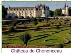
Château de Chenonceau