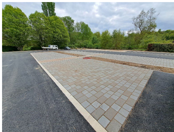
Place de l'église

Les travaux du centre-bourg sont terminés. La réouverture de la circulation est effective depuis le 14 juin. Ces aménagements pérennisent notamment l'arrêt du car scolaire en permettant à celui-ci de faire demi-tour sans reculer afin d'assurer la sécurité des élèves qui en bénéficient.