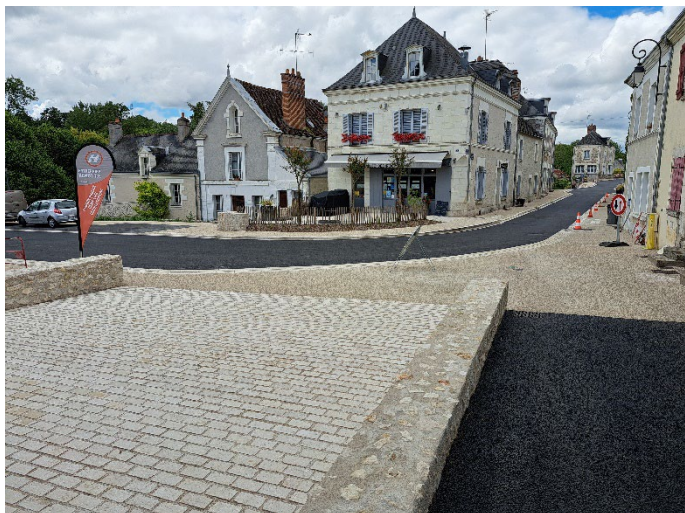
Parvis de l'église + rue du Commerce