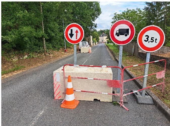
Sécurisation de l'accès depuis le haut de la rue du Commerce