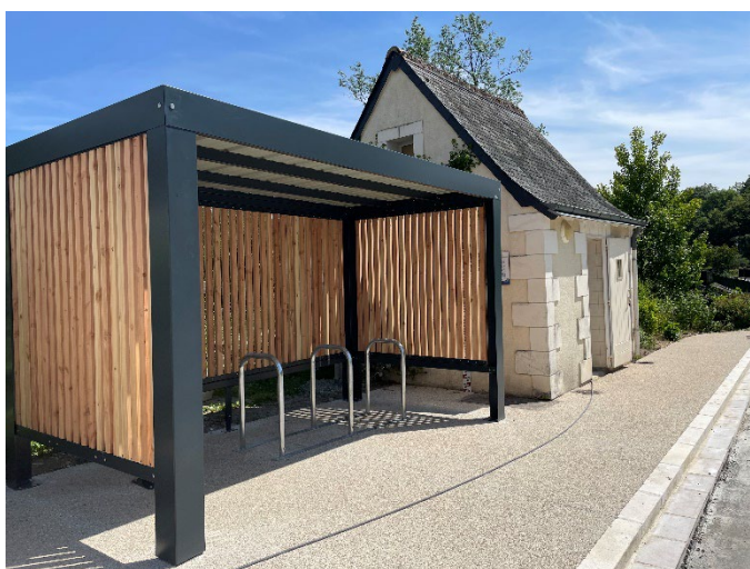
Abri vélo sur la place l'église avec borne de recharge pour vélos électriques