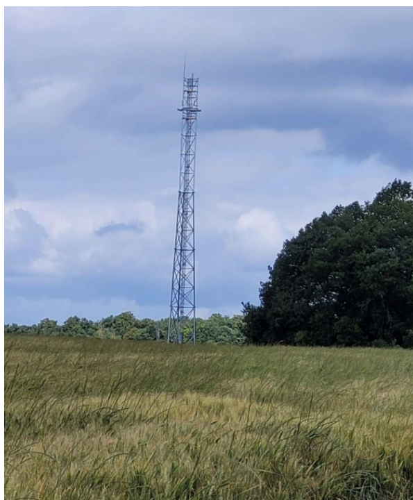
Support antenne 4G installé

Son implantation a été définie afin d'irriguer le plus largement possible le territoire de Courçay, et notamment le bourg actuellement en zone blanche. Le développement de ces installations s'impose compte tenu de la disparition du réseau cuivre à l'horizon 2030.