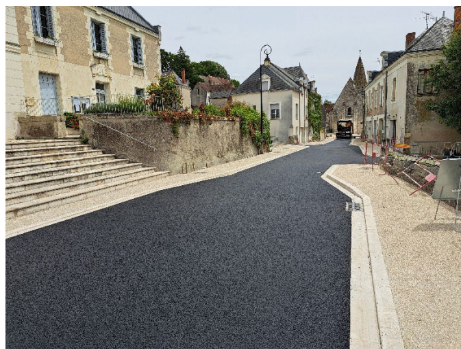
Rue du commerce devant la Mairie

La végétalisation de la zone sera mise en place à l'automne et l'inauguration aura lieu le 26 octobre 2024.