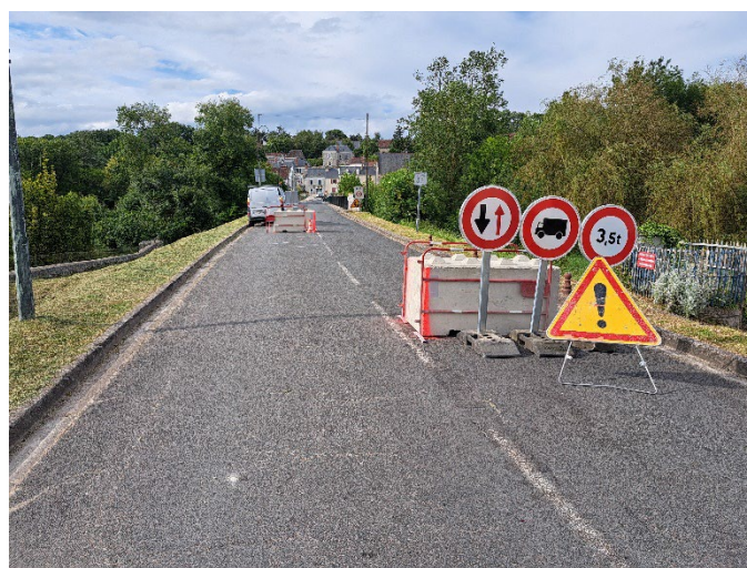
Sécurisation de l'accès depuis la D17

Pour rappel, la circulation est interdite sur la commune de Cormery en traversée de bourg entre le 17 juin et le 09 août 2024. Le Conseil départemental a prévu des déviations qui prennent en compte l'interdiction de traverser le bourg et le pont de Courçay pour les véhicules de plus de 3,5 tonnes (arrêté en date du 15 mai 1998) hors desserte locale. Toutefois, afin de prévenir les abus et préserver les nouveaux aménagements du centre bourg, des blocs bétons sont installés aux entrées de bourg qui permettent le passage des véhicules de 19 tonnes en desserte locale ainsi que la circulation des engins agricoles.